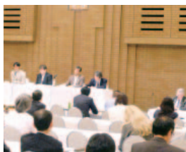
パネルセッションの状況