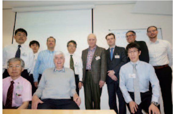
会議風景および参加メンバー